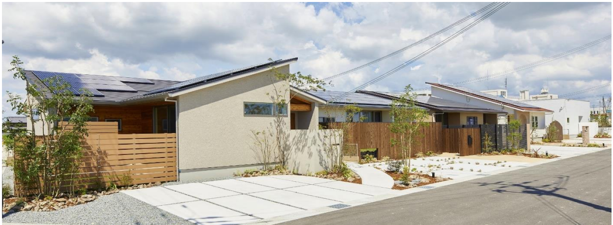
【平屋モデルハウス5棟が建ちならぶ街並み】平屋だけの街「hitotoki」での暮らしをイメージし、平屋住宅のメリットを存分に体感していただくことができます。