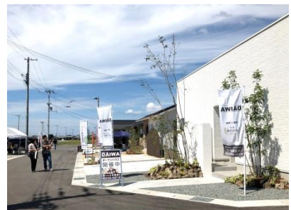
【モデルハウス見学】小さなお子様連れの若いご夫婦も、たくさんご来場いただきました。