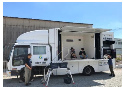
【イベントひろば】キッチンカー、地震体験車などの催し物で、ご来場の方々に楽しんでいただけたました。