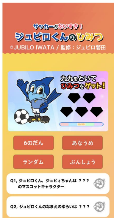
スペシャルページが登場！