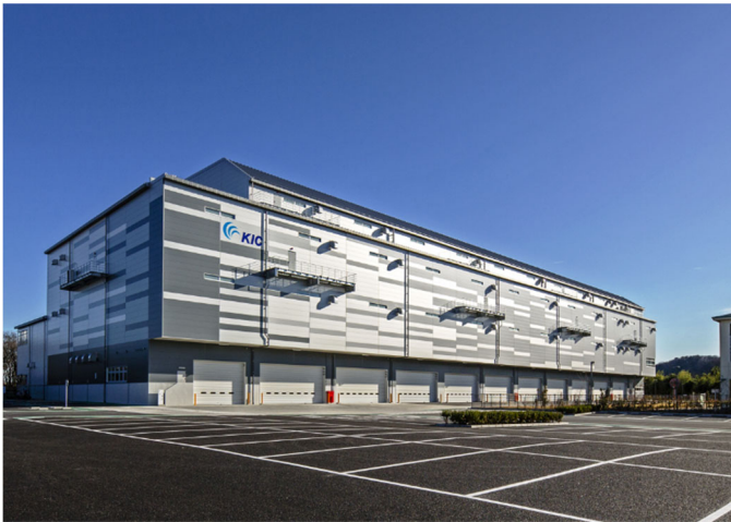
KIC あきる野 DC 外観