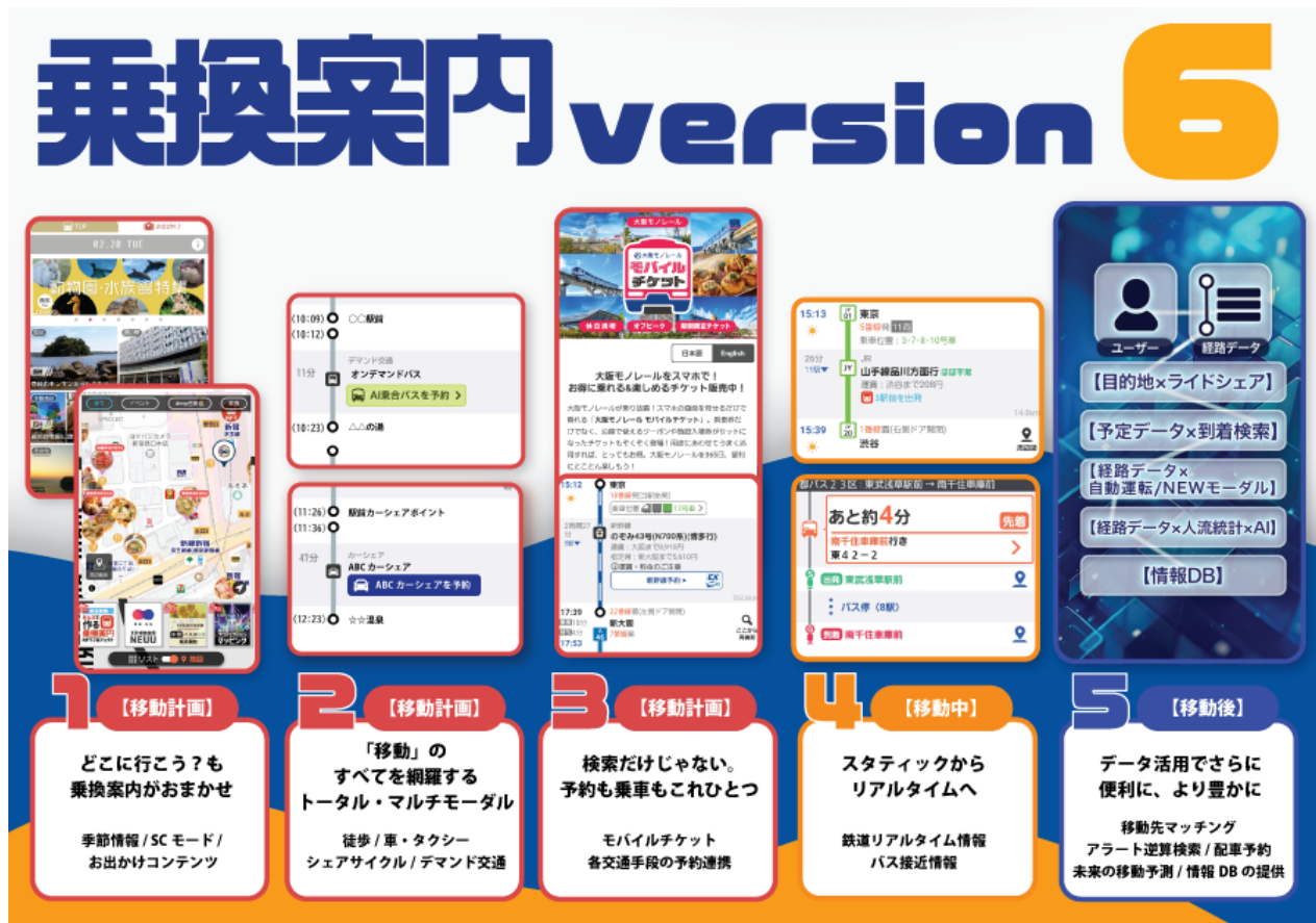
▲「乗換案内 version 6」の概要

「乗換案内 version 6」は、経路検索アプリから進化し、お客様の移動の目的を最適なルート・移動手段で繋ぐ「次世代の移動情報検索プラットフォーム」を目指します。