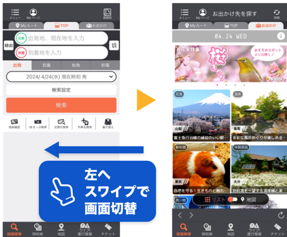
▲お出かけコンテンツの表示方法

また、現在、乗換案内アプリ内に実装しているスマートシティモードは、特定の地域をフォーカスしたモードとなっており、自治体・観光協会などと情報連携した細かなスポット情報の掲載が可能です。現地に到着してからの地域周遊にも活用でき、今後も提供エリアの拡大が予定されています。