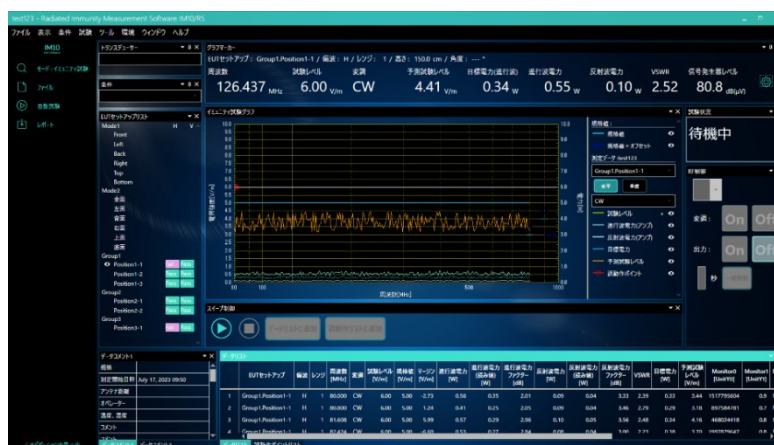
伝導イミュニティ試験ソフトウェア「IM10/CS」

また、7月24日(水)から3日間、東京ビッグサイトで開催中の「TECHNO-FRONTIER 2024」の構成展「第37回 EMC・ノイズ対策技術展」にて当製品を初展示しています。(ブース番号：2E-18)