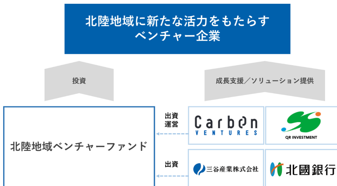
ファンドの体系図