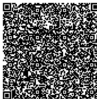
ステッカーコレクション#1