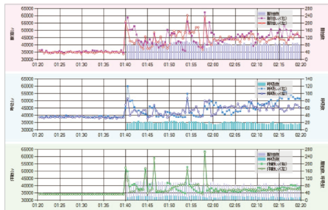
【バイタルデータグラフィイメージ】

マイクロ波で体表の動きをセンシングし、おおよその脈拍・呼吸を推測することができます。