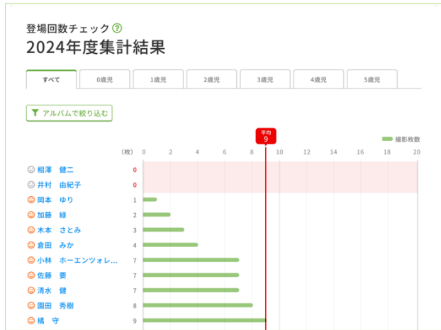
<集計結果表示(平均枚数の表示)>