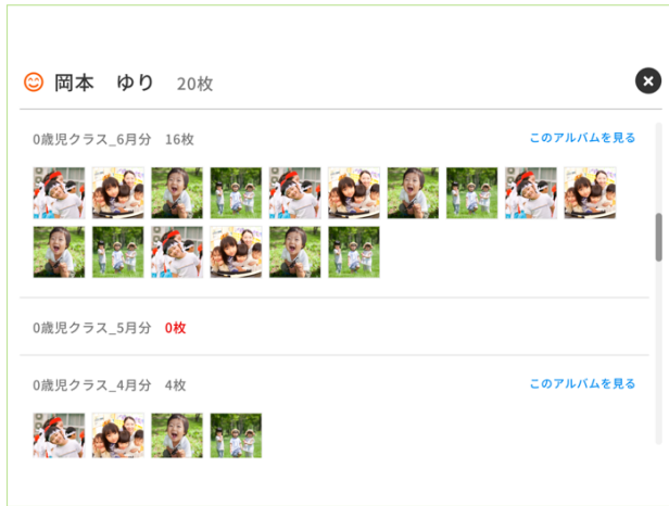
<園児ごとの詳細画面>